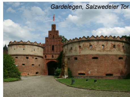
Gardelegen, Salzwedeler Tor