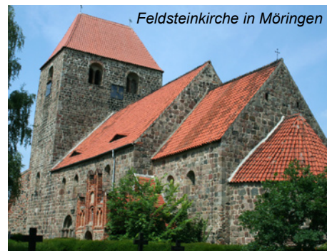
Feldsteinkirche in Möringen