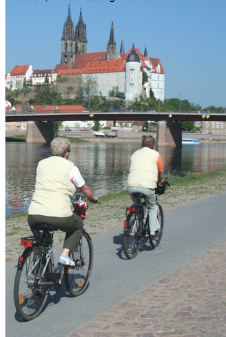
Meißen, Albrechtsburg mit Dom