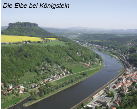
Die Elbe bei Königstein

Die Elbe entspringt im Riesengebirge, mündet in die Nordsee, ist 1165 km lang und fließt durch eine der schönsten Landschaften Deutschlands. Von der „Sächsischen Schweiz“ mit den zerklüfteten Felsformationen führt die Radtour entlang der sächsischen Weinberge in die Weite der Elbtalauen und zum Wörlitzer Gartenreich. Bedeutende Städte wie Dresden, das einstige „Elb-Florenz“ und die Lutherstadt Wittenberg, sowie Burgen und Schlösser lassen diese Tour zu einem Erlebnis werden.