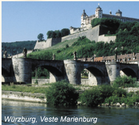
Würzburg, Veste Marienburg