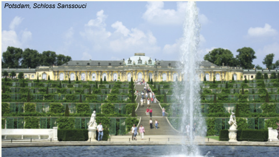
Potsdam, Schloss Sanssouci

Theodor Fontane hat im 19. Jahrhundert seine brandenburgische Heimat durchwandert. Mit dem Fahrrad folgen Sie seinen Spuren durch die Mark Brandenburg. Dabei erleben Sie den naturnahen Lauf der Havel und durchradeln das weite Havelland. In Potsdam und Brandenburg treffen Sie auf viele Zeugnisse der brandenburgisch-preußischen Geschichte.