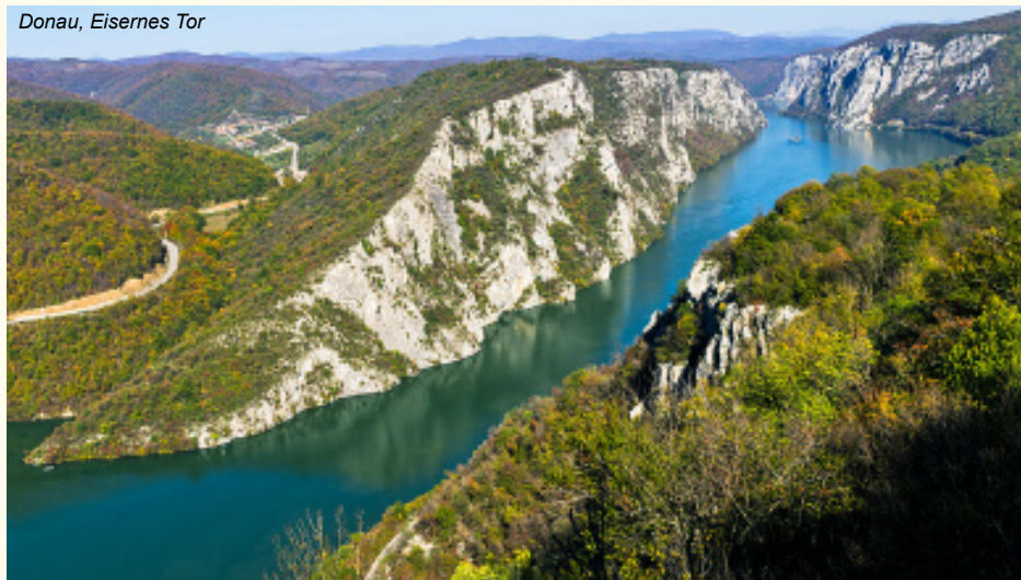
Donau, Eisernes Tor

Parkplatz Passau: Parkplatz Freigelände EUR 83,-/Woche, Garage EUR 104,-/Woche inkl. Bus-Transfer zum/vom Schiff, zahlbar vor Ort, Voranmeldung erforderlich.