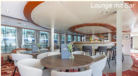
Lounge mit Bar

Entlang des einstigen Eisernen Vorhanges führt ein schmaler Radweg von der Festungsanlage Devin zum imposanten Schloss Hof mit einem der prachtvollsten Barockgärten Europas und weiter nach Bratislava. (ca. 15-45 km)